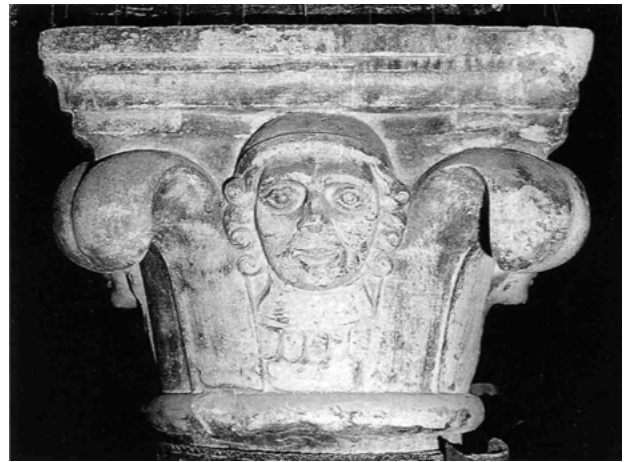
Palazzo Ziani, particolare del capitello Surian.