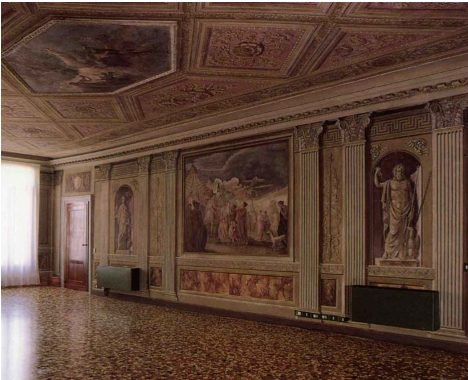
Salone d'ingresso, veduta d'insieme della parete sinistra.