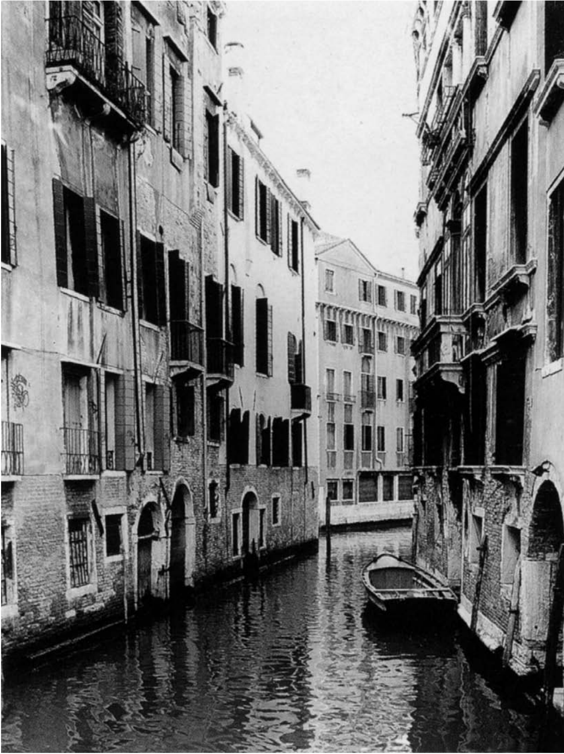
Fronte di palazzo Ziani su rio della Guerra.