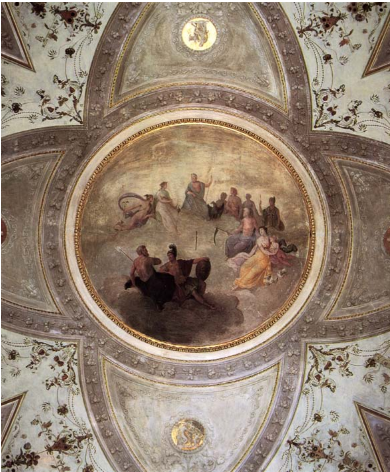
Sala del Consiglio degli Dei, il tondo centrale del soffitto.