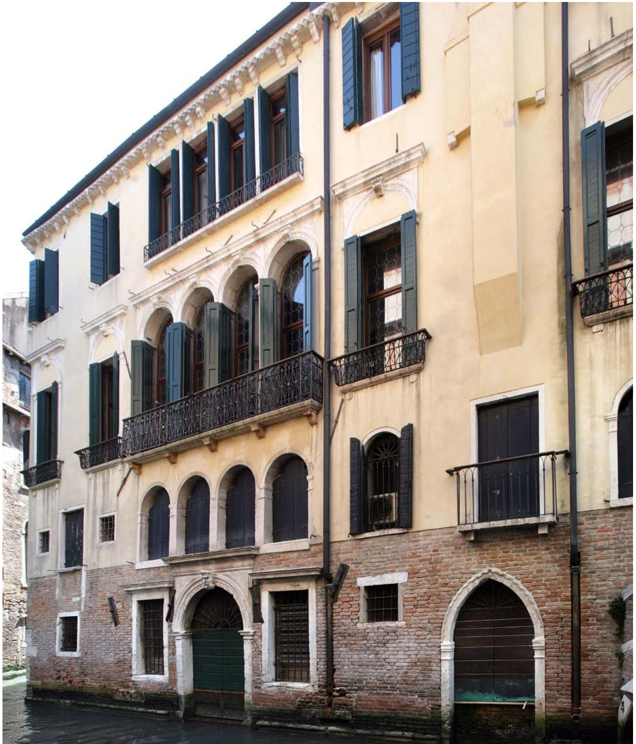
Palazzo Ziani, il fronte dell'edificio lungo il rio dei Baretteri. Nella rifabbrica seicentesca le componenti gotiche e rinascimentali del complesso sono state sapientemente modulate all'interno della macchina architettonica.