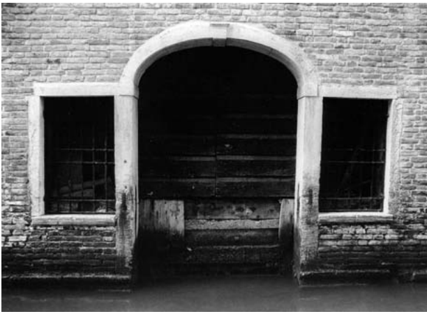
Entrata d'acqua seicentesca sul rio di San Zulian.