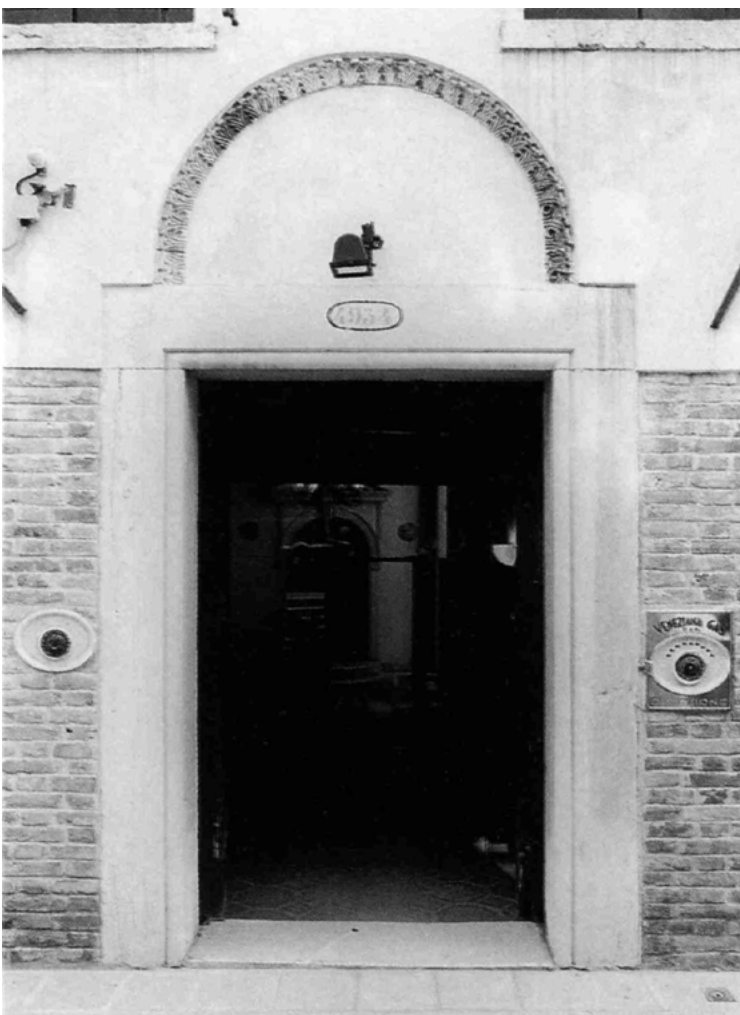
Un antico arcone bizantino sormonta la porta, inserito nella mole seicentesca dell'edificio.