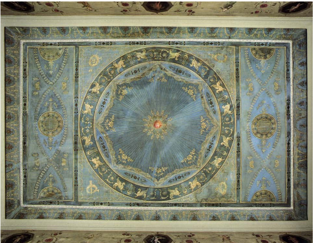
Alcova, soffitto a padiglione con i segni dello zodiaco e, al centro, la testa di Zebo.