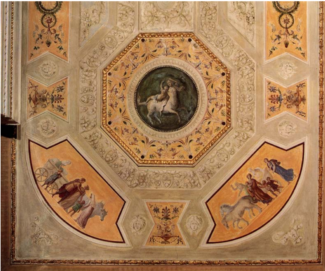
Anti-Alcova, parte soffitto con tondi con i centauri e scene di rituali pagani agli angoli.