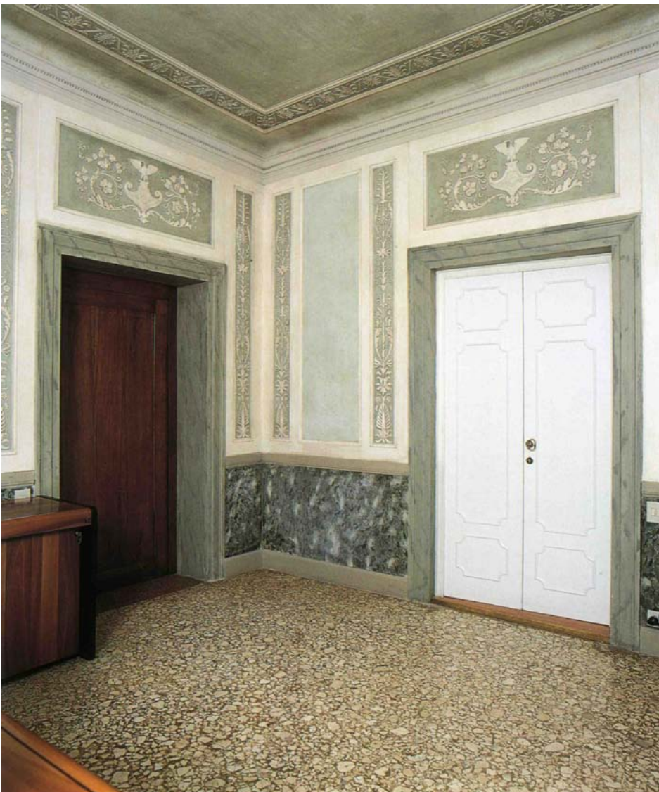
Il gabinetto con stucchi bianchi sul fondo verde a tralci e girali.