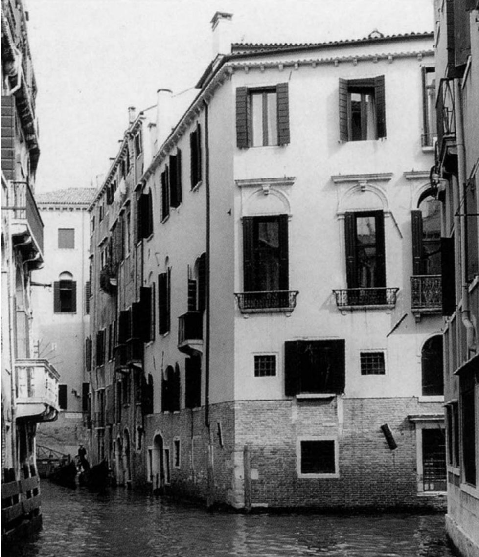
Palazzo Ziani, tra rio dei Baretteri e il rio della Guerra.