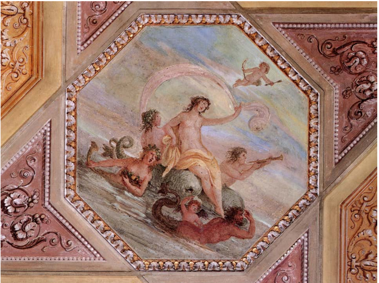
Sala di Nettuno, una delle scene ottagonali del soffitto con divinità marine.