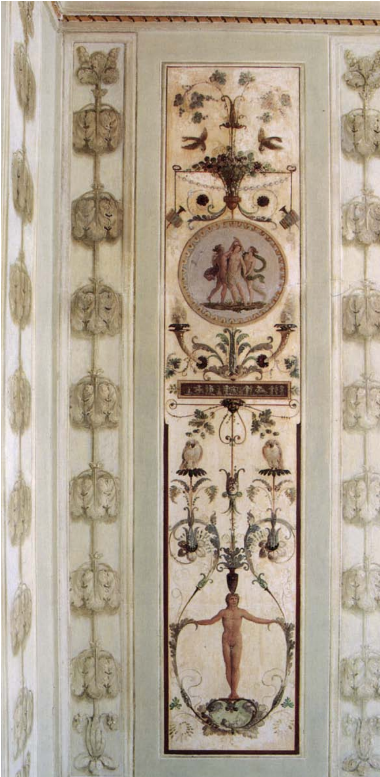
Anti-Alcova, processione romana e veduta d'insieme delle grottesche.