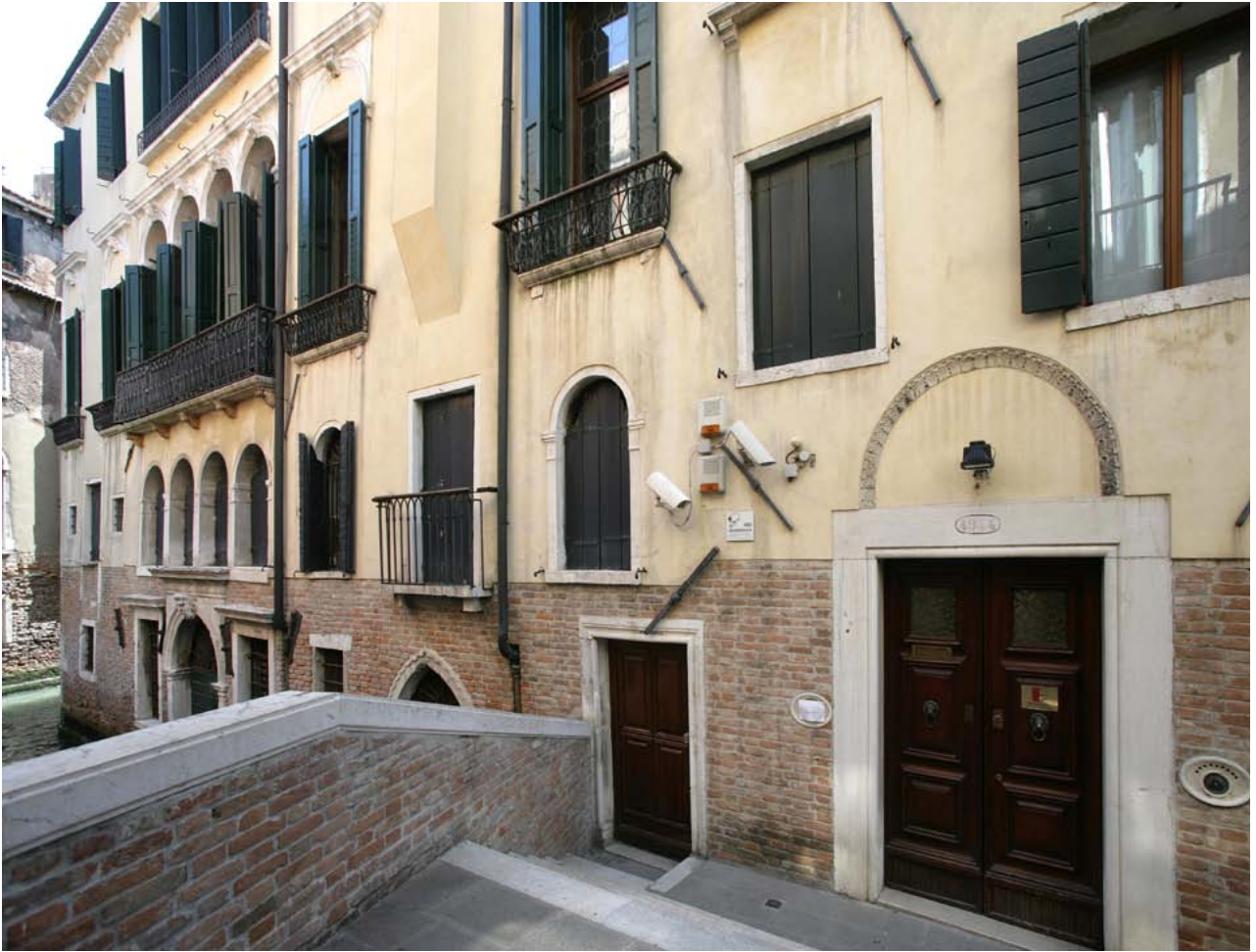
L'ingresso principale di palazzo Ziani, cui si accede dal ponte in pietra d'Istria.