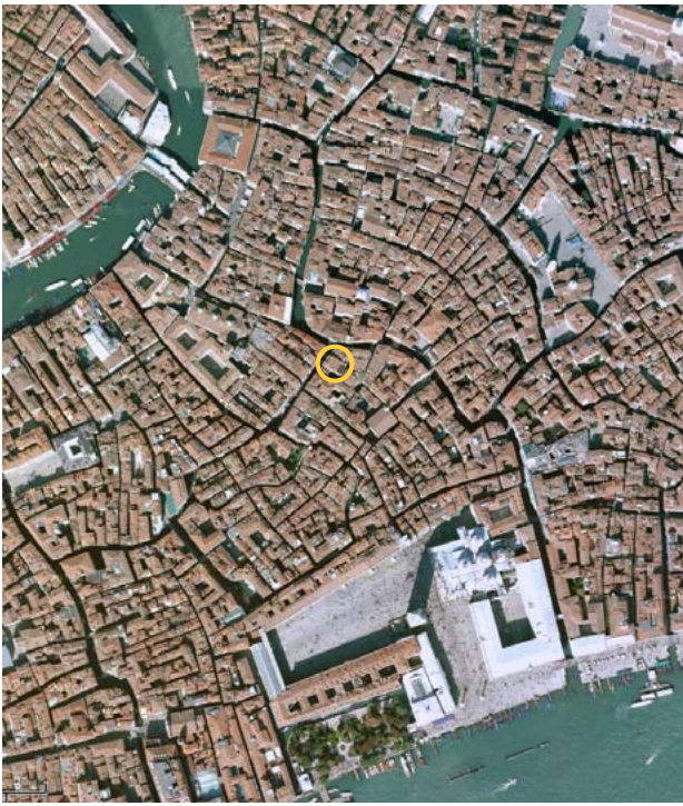
Palazzo Ziani San Marco 4934 30124 Venezia