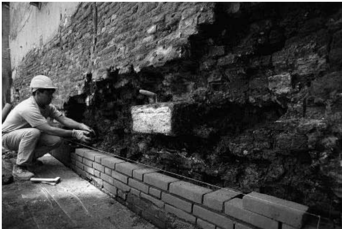
Restauro di una sponda in Rio de le Muneghete, maggio 1998

interventi sia la migliore possibile, compatibilmente con i criteri di conservazione.