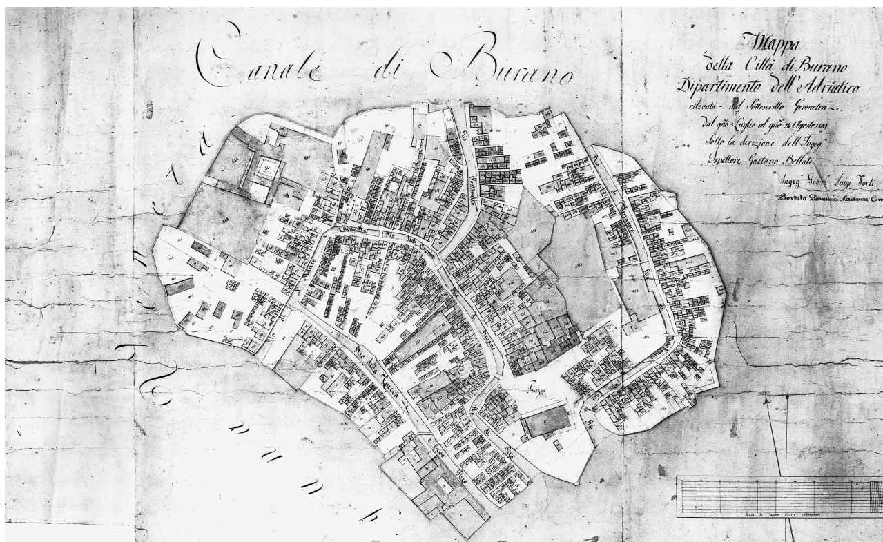
ASV, Catasto Napoleonico, Burano, mappa 8

Costruiti con elementi lignei e frammenti di laterizi e ceramici, i due manufatti sembra abbiano avuto lunga vita, a giudicare dalle discrepanti datazioni del legno e dei frammenti ceramici. Il primo, infatti, in entrambi i casi sembra risalire, sulla base delle