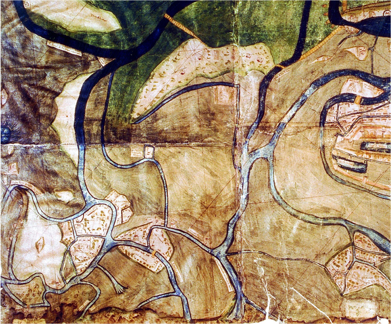
Archivio di Stato di Venezia, Savi ed Esecutori alle Acque, Laguna, d. 128, XVI secolo, Venezia, comprensorio della città con le sue isole, laguna tra San Giuliano e il litorale da San Pietro in Volta fino alla punta di Lio Maggiore oltre il Cavallino

quale discorre di Altino, delle sue sei porte, e di come gli abitanti dei quartieri che facevano capo a tali ingressi chiamarono le isole da loro occupate con i rispettivi nomi delle porte: Torcello, Mazzorbo, Burano, Murano, Costanziaco, Ammiana.