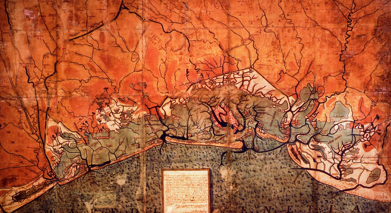
ASV, Savi ed Esecutori alle Acque, Laguna, d. 13, 1695, Laguna di Venezia, comprensorio dal litorale Adriatico all'entroterra fino oltre Piove di Sacco e Treviso, tra la foce dell'Adige e quella del Piave Vecchio. Autore Angelo Minorelli, copia tratta da Cristoforo Sabadino, 1556

medico o di gastaldo; l'obbligo per chi sbarca di sottoporsi alla visita sanitaria 14 ; la necessità di mantenere in funzione i pozzi pubblici, in particolar modo quello della piazza che era l'unico a fornire acqua buona, mentre dagli altri usciva solamente acqua salata.