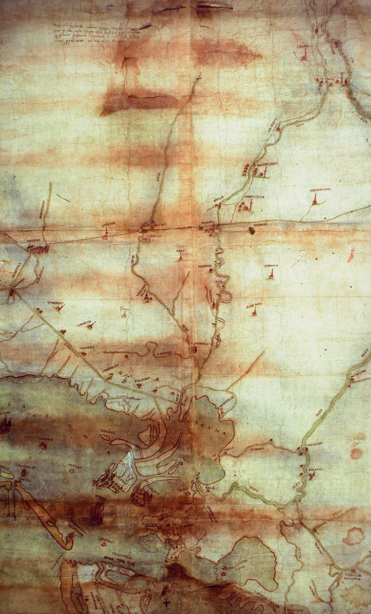
ASV, Savi ed Esecutori alle Acque, Laguna, d. 8, 1545, Laguna di Venezia, carta topografica della laguna, delle isole delle Vignole e di Santa Cristina e con una vasta zona della terraferma, da Mestre a Levada fino a Meolo Vecchio. Autore Cristoforo Sabadino

Continuano i tentativi di regolamentazione della caccia, in questo caso agli uccelli, e della pesca: di quest'ultima viene controllata anche la vendita, che deve avvenire solamente a Rialto, o al limite nelle isole stesse, ma mai nella terraferma.