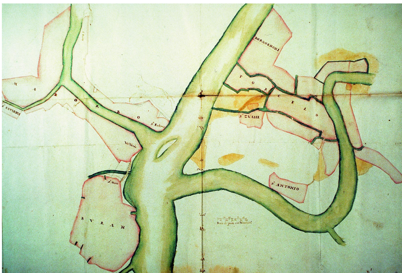
ASV, Savi ed Esecutori alle Acque, Relazioni, b. 525, d. 9, 1670, Laguna, vasta area lagunare ove sono planimetricamente segnate le confinazioni delle isole di Mazzorbo, Torcello, Burano con l'intersecazione dei canali. Autore Iseppo Benoni

Un altro segno di civiltà sono le varie regole impartite alle cariche pubbliche, come quella di