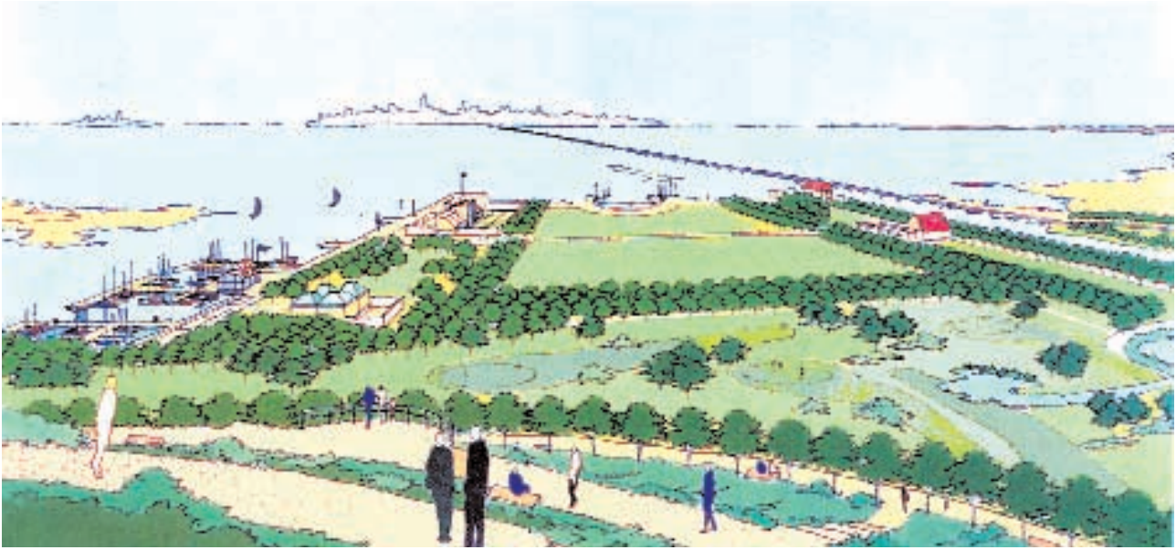
Il progetto per il parco di San Giuliano

associazioni le prime precarie cure e sistemazioni. Le attività principali sono la voga alla veneta e il canottaggio, ma in breve tempo si aggiungono la vela e la canoa. E negli anni ottanta, in base a esigenze specifiche, di ordine tecnico ma anche associativo, nascono nuovi sodalizi, che con molto spirito di adattamento riescono non solo a garantire le uscite in barca ai primi pochi associati, ma raggiungono in breve la capacità di organizzare corsi e iniziative volte ad allargare ad altri cittadini le conoscenze e competenze necessarie per poter esercitare la voga – alla veneta e all’inglese –, la vela o la canoa. Oggi nell’area tra Mestre e Venezia di cui si parla le società nautiche sono una dozzina, contano più di 2000 soci, hanno permesso e insegnato ad andare in barca ad almeno 10.000 cittadini, e detengono complessivamente una flotta di barche vicina alle 500 unità suddivisa nei principali settori, ossia vela, voga e canoa. Sono in buona parte mezzi di proprietà comune, resi disponibili agli associati a un costo sostenibile per qualsiasi fascia sociale.