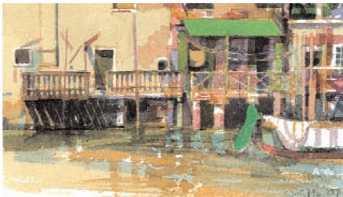
Geoffrey Humphries, Rio Ponte Lungo - Giudecca , 2003