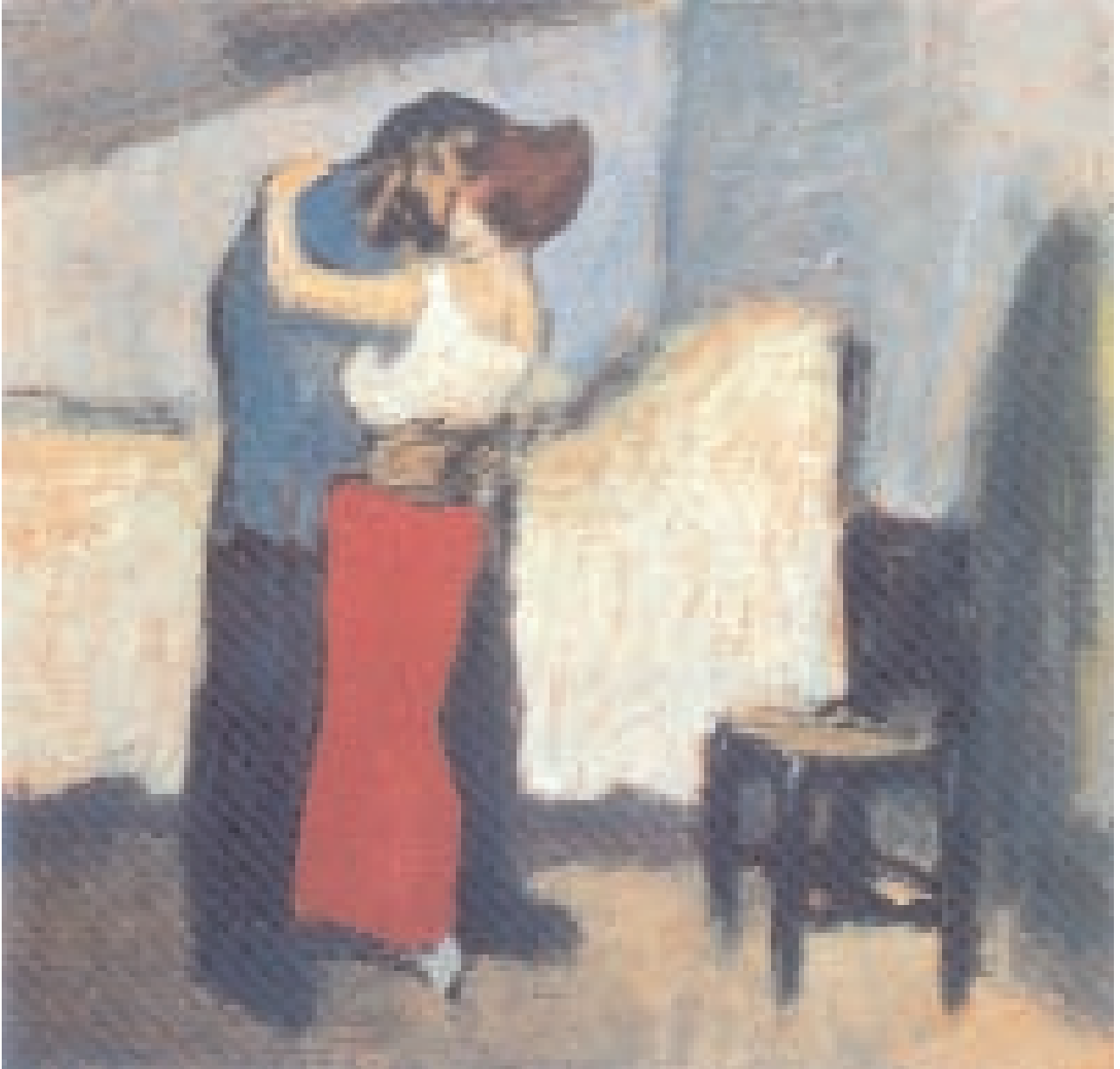
Pablo Picasso, L'appuntamento, 1900, Mosca, Museo Puškin