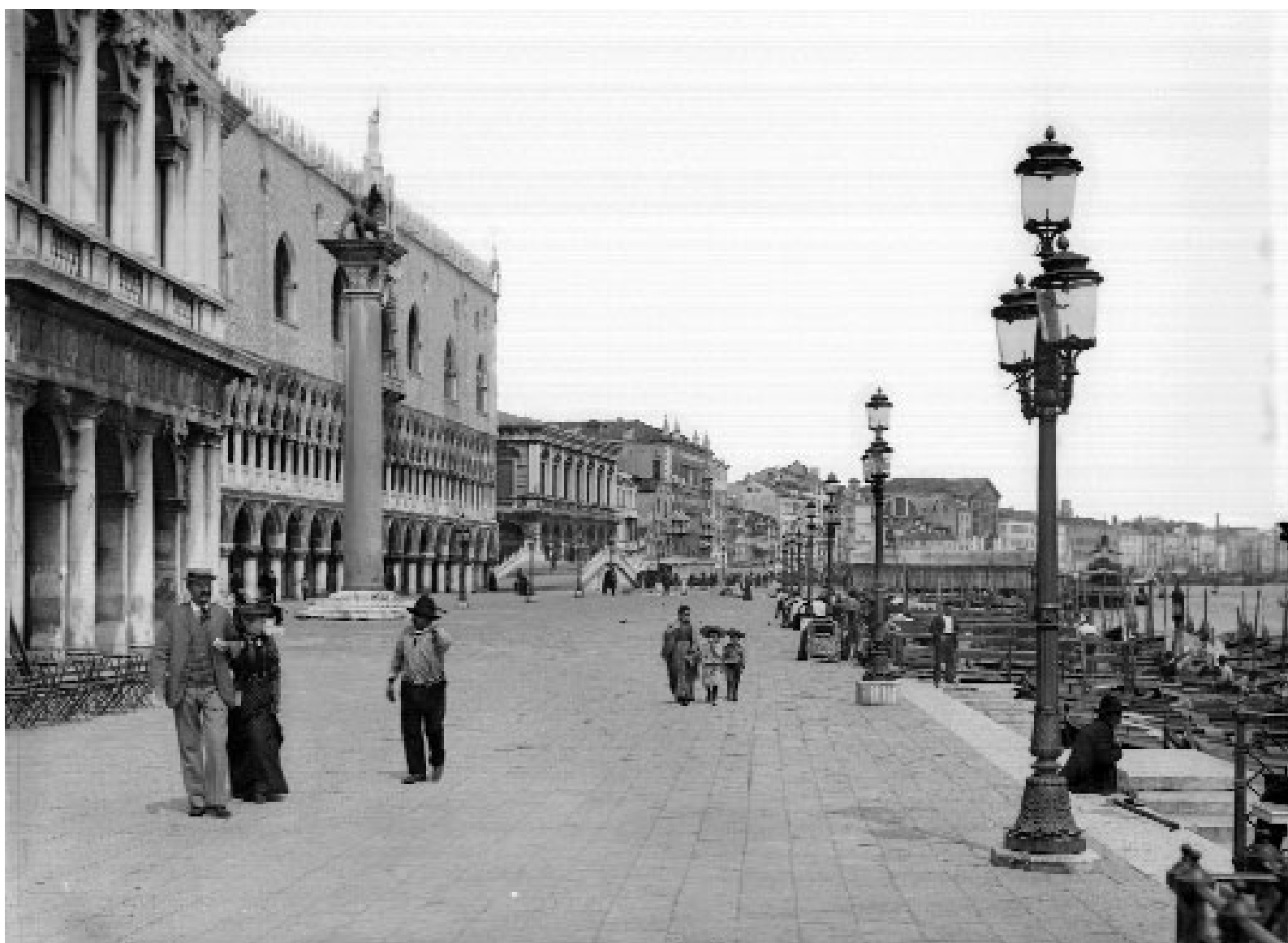
Il Molo verso la riva degli Schiavoni, fine Ottocento